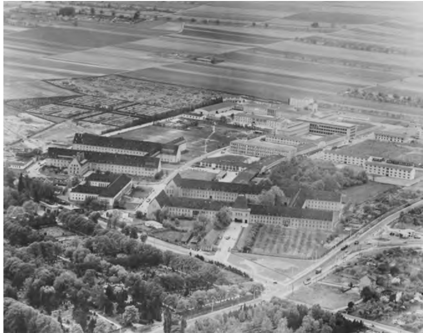
Abbildung 3: Luftbild des Campus, ca. 1956, vgl. (Ansprachen, 1956, S.9).

tenberg Universität feierte im Mai 1956 ihr zehnjähriges Bestehen. Gleichzeitig wurden zu dieser Zeit erste Erweiterungsbauten jenseits des ursprünglichen Hauptkomplexes der ehemaligen Flakkaserne, des heutigen Forums, erstellt. Es handelt sich dabei vor allem um zwei Neubauten der Naturwissenschaften, nämlich den 1956 bezogenen Neubau der physikalischen Institute, den sogenannten “Bau J” und den etwas später, nämlich erst 1958 (?), bezogenen Bau M, welcher die chemischen Institute beherbergen sollte. Foto 3 zeigt ein Luftbild des Campus der JGU aus dem Jahr 1956. Bau J und Bau H sind deutlich zu erkennen als langgestreckte Querbauten zwischen den beiden Achsen der (erst später so benannten) beiden Straßen Johann-Joachim-Becher Weg und Jakob-Welder-Weg. Leider sieht man aus dieser Perspektive jedoch nicht die uns interessierende Südfassade. Wir können aber aus anderen Quellen den genaueren Zeitpunkt der Anbringung des Zitats erschließen.