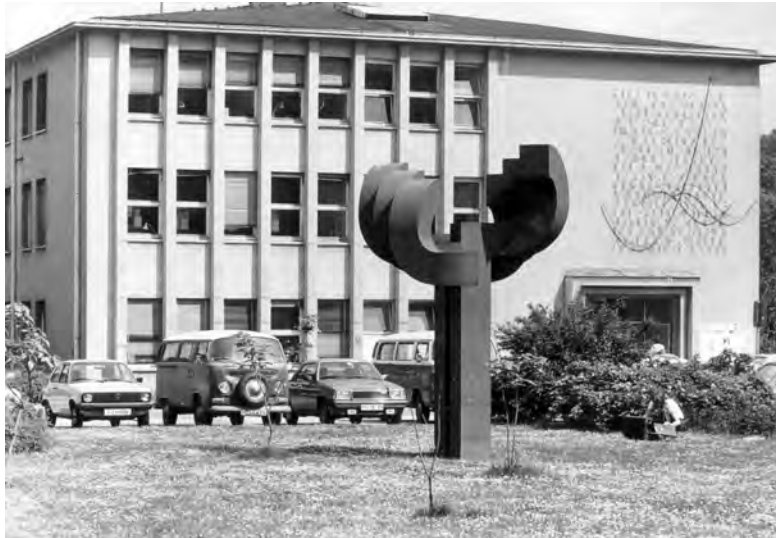
Abbildung 4: Bau J, vgl. (Krafft, 1977, S. 120).

Jubiläum fand mit einem zweitägigem Festakt gut ein Jahr später am 9. und 10. Mai 1956 statt (Ansprachen, 1956).