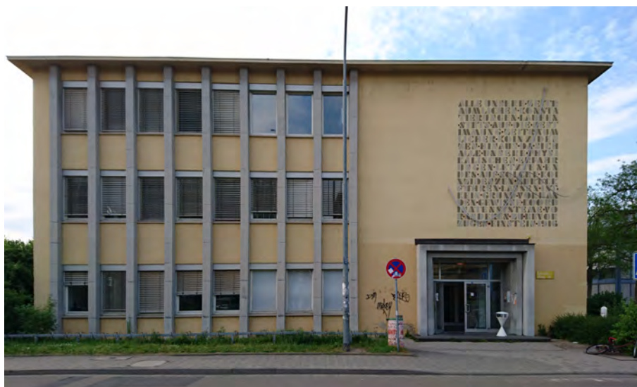
Abbildung 1: Die Südfassade des ehemaligen Physikalischen Instituts, Johann-Joachim-Becher Weg 14, Aussehen 2017.

Der aufmerksame Beobachter wird auf dem Campus der Johannes Gutenberg-Universität an der südlichen Stirnfassade des Gebäudes Johann-Joachim-Becher-Weg 14, oberhalb des Eingangs, einen künstlerisch angebrachten Schriftzug zusammen mit zwei vorgeblendeten geschwungenen Metalllinien finden, siehe Abb. 1, 2.