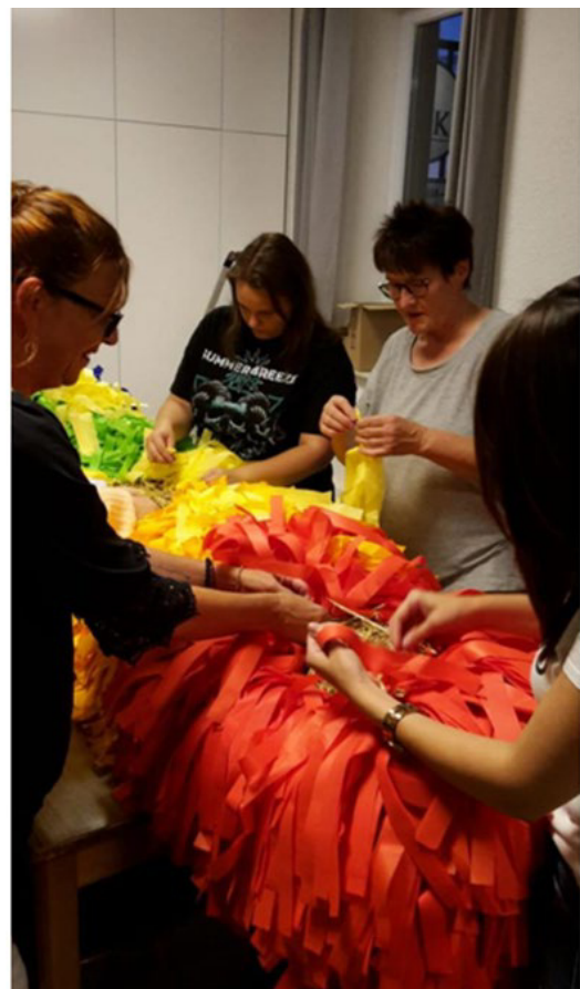
Abbildungen 2 u. 3: Der Kerwestrauß entsteht