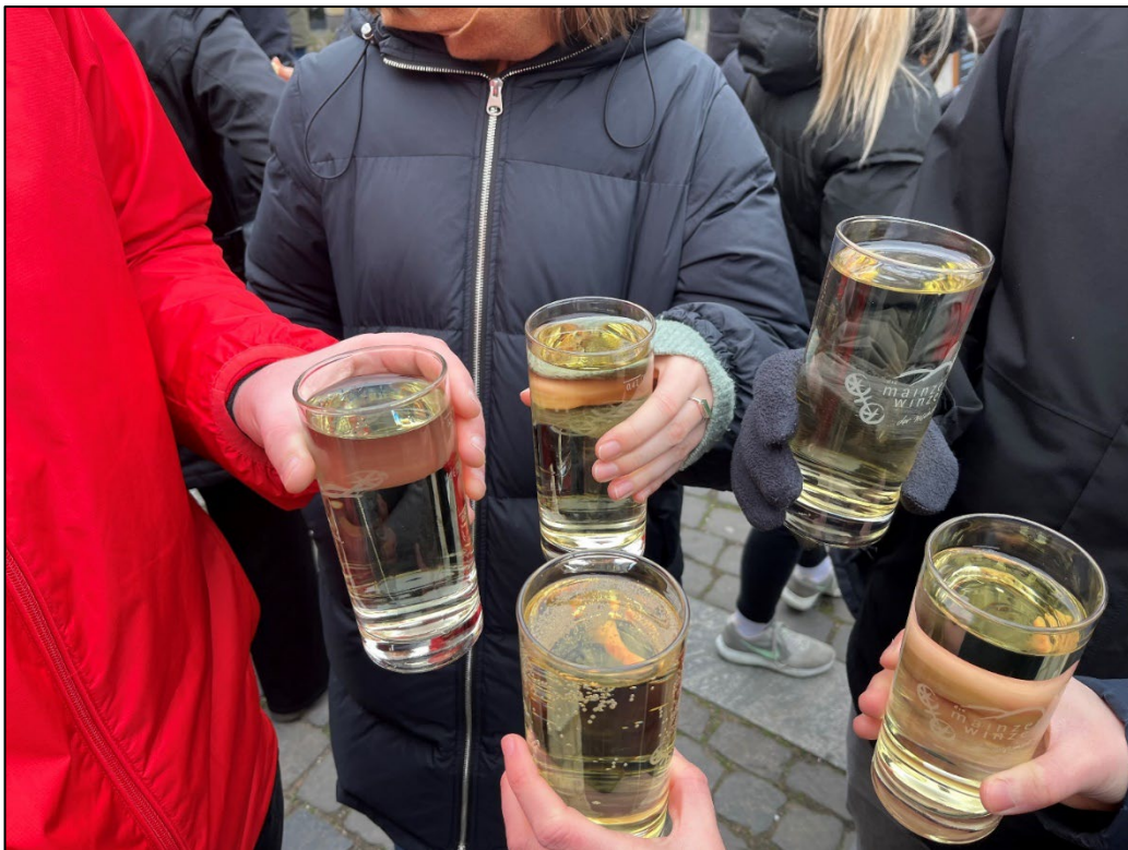
Abbildung 2: Besucher:innengruppe mit Weißweinschorle, 04.03.2023