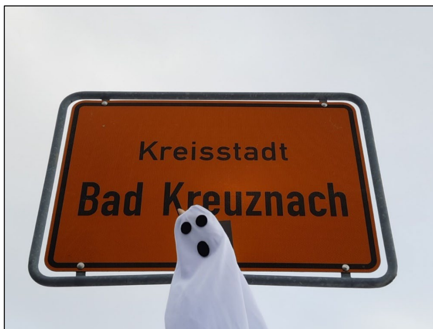
Abbildung 1: Geist vor Bad Kreuznach

„Die Amerikaner gehen, Halloween bleibt“, titelte der Oeffentliche Anzeiger Bad Kreuznach in der Ausgabe vom 31.10.2001 (S. 23). In diesem Jahr wurden zum 31.12. alle US-Truppen abgezogen. Es war eine Zäsur für die Stadt, waren doch seit 1951 die US-Truppen fester Bestandteil des Stadtbildes. In den 50 Jahren der Stationierung wurde Halloween in Bad Kreuznach schon gefeiert, als es deutschlandweit noch nahezu unbekannt war. Doch wie wurde über den „fremden“ Brauch in Bad Kreuznach berichtet, und wie entwickelte sich die Perspektive der Einheimischen und die Darstellung? Anhand von Zeitungsartikeln möchte ich dem Wandel der Perspektive auf diesen Brauch von der Randnotiz vor Allerheiligen über die Neugierde zu einem „neuen“ Brauch nach Abzug der brauchprägenden Gruppe nachgehen.