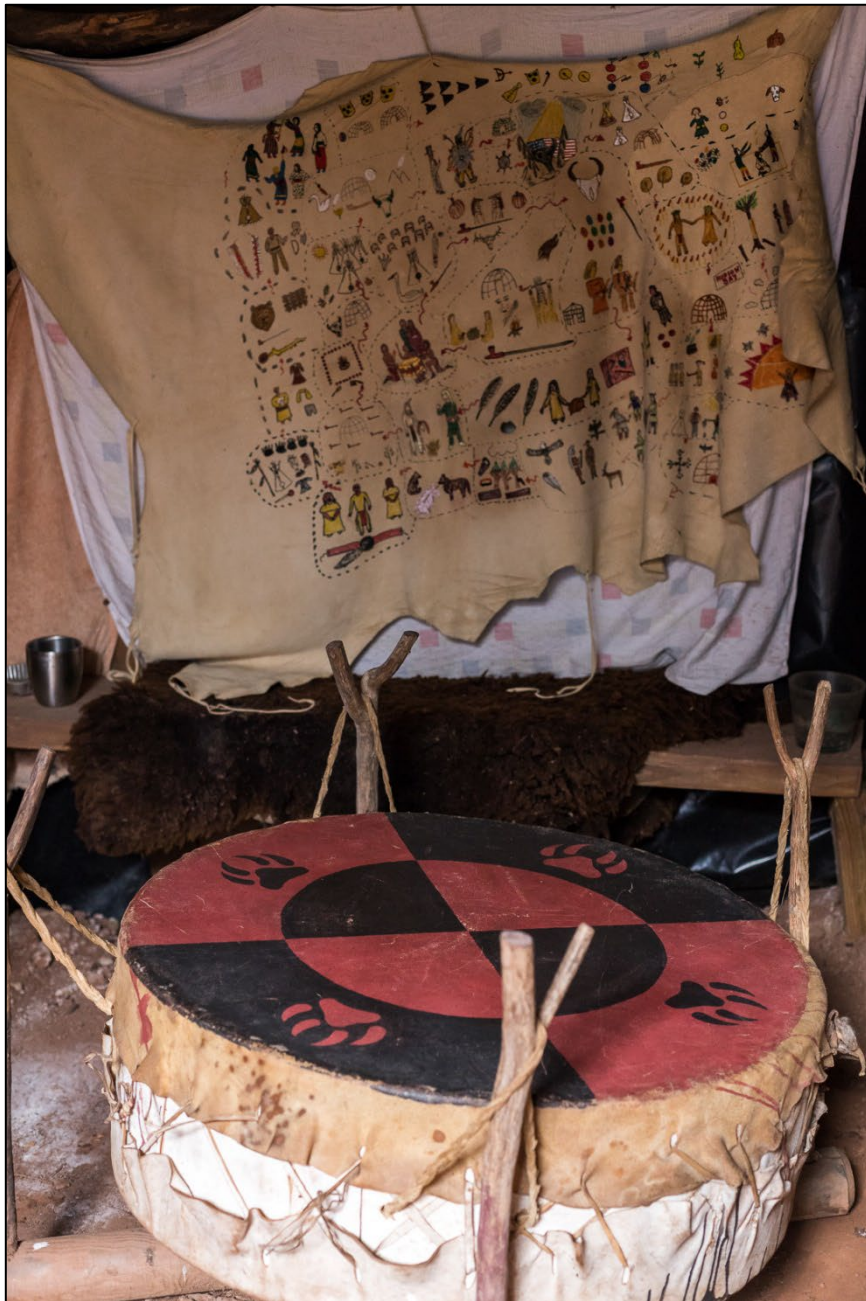
Trommel des Wolfsträumer e.V. und eine der Häute, auf welcher der Verein Erinnerungen an vergangene Feste festhält, 03.10.2022