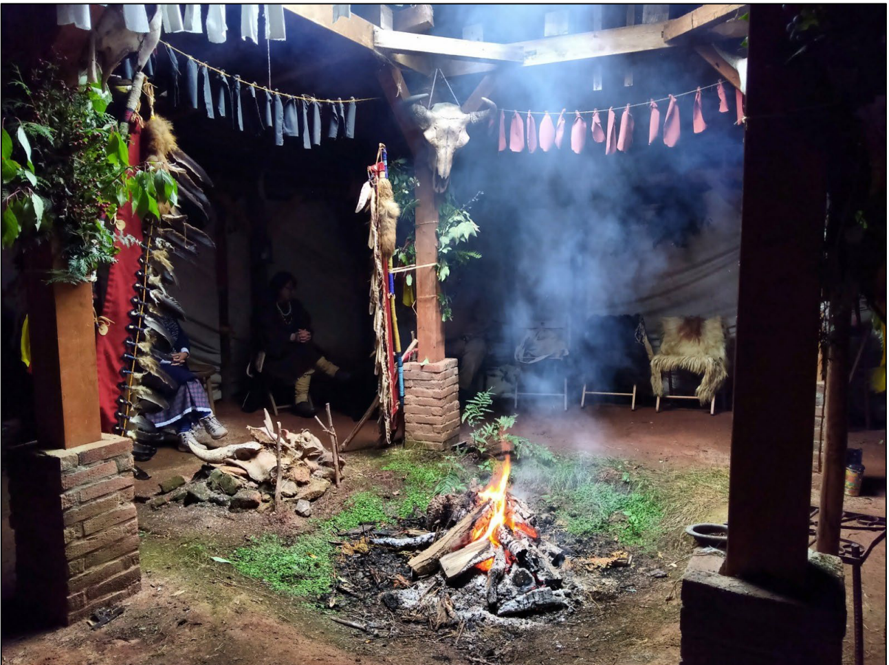
Abbildung 1: Die vier zentralen Pfeiler des Rundbaus auf dem Vereinsgelände der Wolfsträumer e.V., 03.10.2022

„das Gefühl der Zusammengehörigkeit. [...] Als Fremder in die Gruppe reinkommen und sich direkt aufgenommen fühlen, [...] das ist letztendlich das, was mich hier gehalten hat. Und das ist etwas, was ich halt eben, zumindest in den Kernen der Vereine, die wir so im Laufe der Zeit mal irgendwo kennengelernt haben [...], auf jeden Fall auch gesehen habe.“