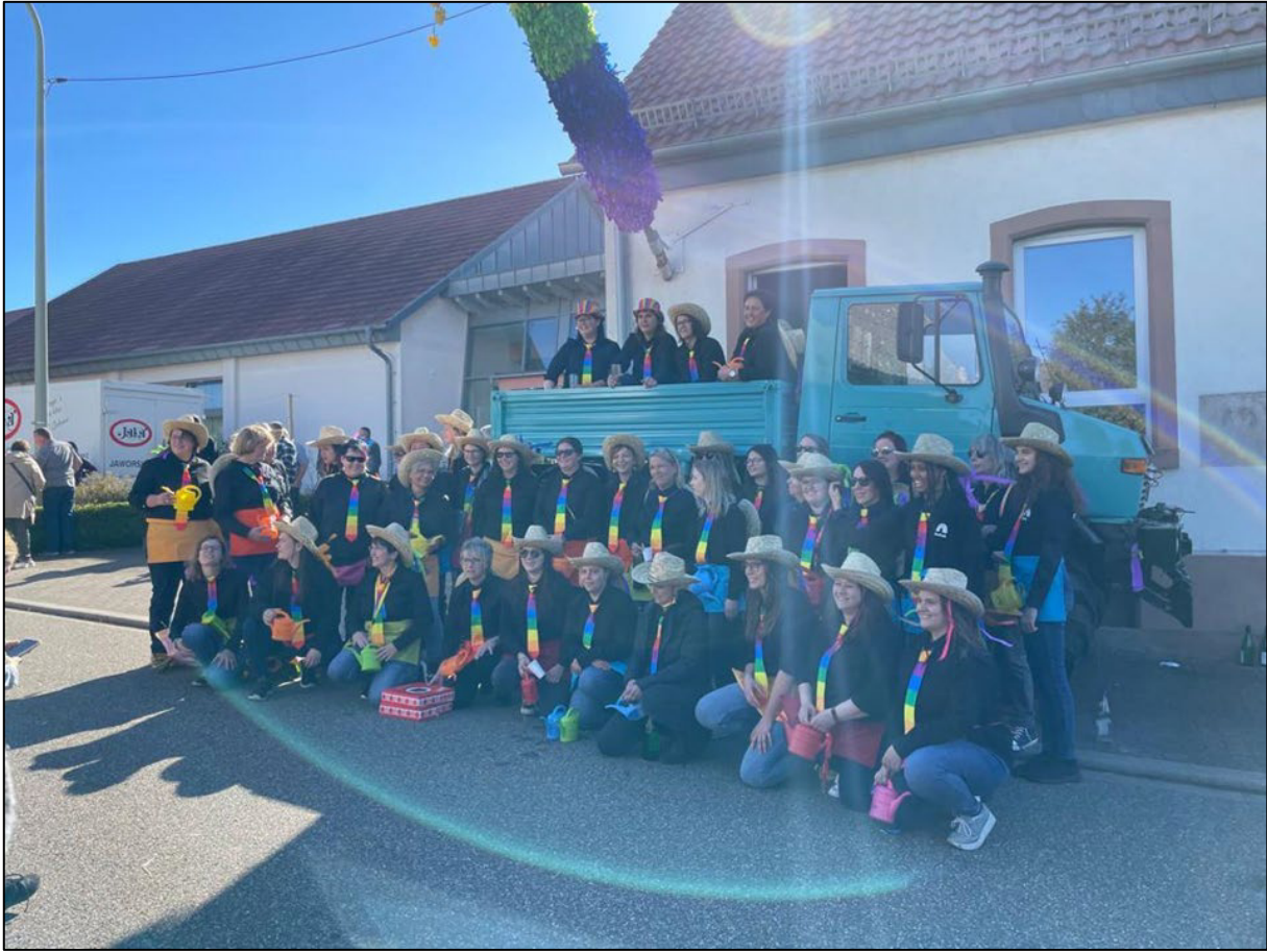
Abbildung 1: Gruppenbild der „Straußmäd“ nach dem Umzug

Meine Nervosität ist auf dem Höhepunkt, als der Zug das Haus meiner zukünftigen Schwiegereltern erreicht. Freunde und Verwandte haben sich in unserem Hof versammelt. All meinen Mut zusammennehmend, rufe ich so laut ich kann: „Un die Harschbeier Kerb soll lebe!“ Die Gemeinschaft der Frauen antwortet mit einem „Hoch“. Der Kerwespruch umfasst mehrere Zeilen, die im Wechsel zwischen Einzelakteurin und Chor, bestehend aus der restlichen Gruppe, gerufen werden. Der Kerwespruch ist jedes Jahr identisch, aber variiert von Ort zu Ort. Der Kerwestrauß und der Kerwespruch sind Brauchelemente. Die Kirchweih ist ein mehrtägiges Dorffest, welches in der Regel von der „Straußjugend“ – einer Gruppe freiwilliger, meist junger Männer aus dem Ort – ausgerichtet und organisiert wird. In Harsberg ist zusätzlich auch der Vereinsring, insbesondere der Sportverein stark in die Ausrichtung der Kerb eingebunden.