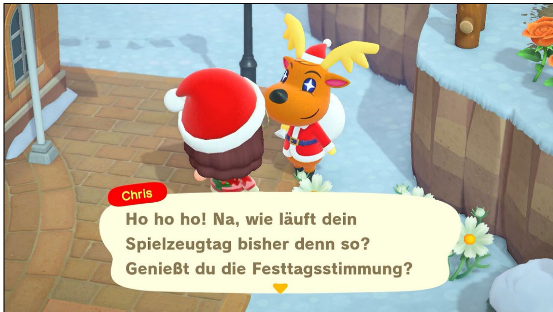
Abbildung 2: Chris, das Rentier

eine rote Zipfelmütze und einen roten Mantel – jeweils mit weißem Besatz – sowie einen Sack, den er über die Schulter geworfen hat (s. Abbildung 2). Doch das süße Rentier hat ein Problem: Es benötigt dringend Hilfe beim Verteilen der Geschenke, die es für alle Inselbewohner:innen besorgt hat. Spieler:innen, die mit Chris sprechen, bekommen deshalb den Auftrag, die Geschenke an ihre Nachbar:innen zu verteilen.