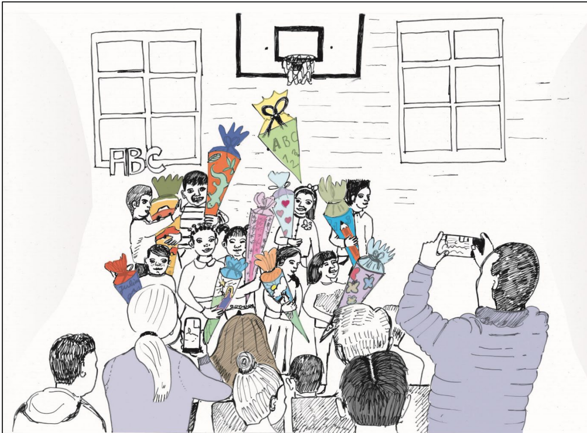
Abbildung 2: Die neuen Erstklässler/innen stehen als Klasse mit ihren Schultüten auf der Bühne (Illustration: Mariana Espinola) 1