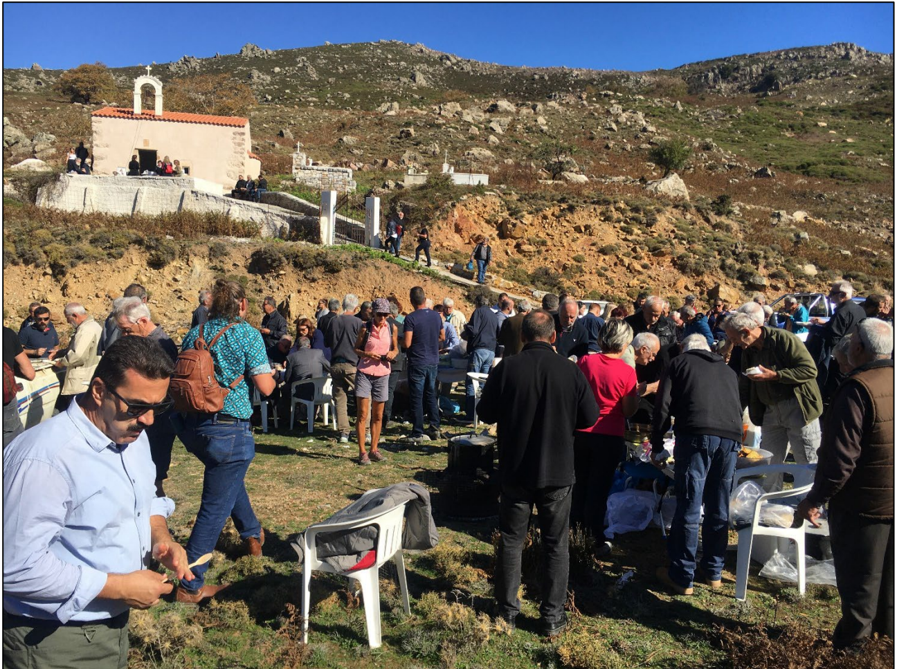
Abbildung 2: Besucher:innen drängen sich vor dem Buffet, an welchem verschiedene Speisen ausgegeben werden. Die Veranstaltung hat sich inzwischen gänzlich auf den Platz unterhalb der Kapelle verlagert

mit ihren Kanistern durch die Menge und schenken den Umstehenden ihren neuen Jahrgang aus, denn dieser ist zum Brauchtermin Anfang November zum Verzehr bereit und muss verkostet werden.