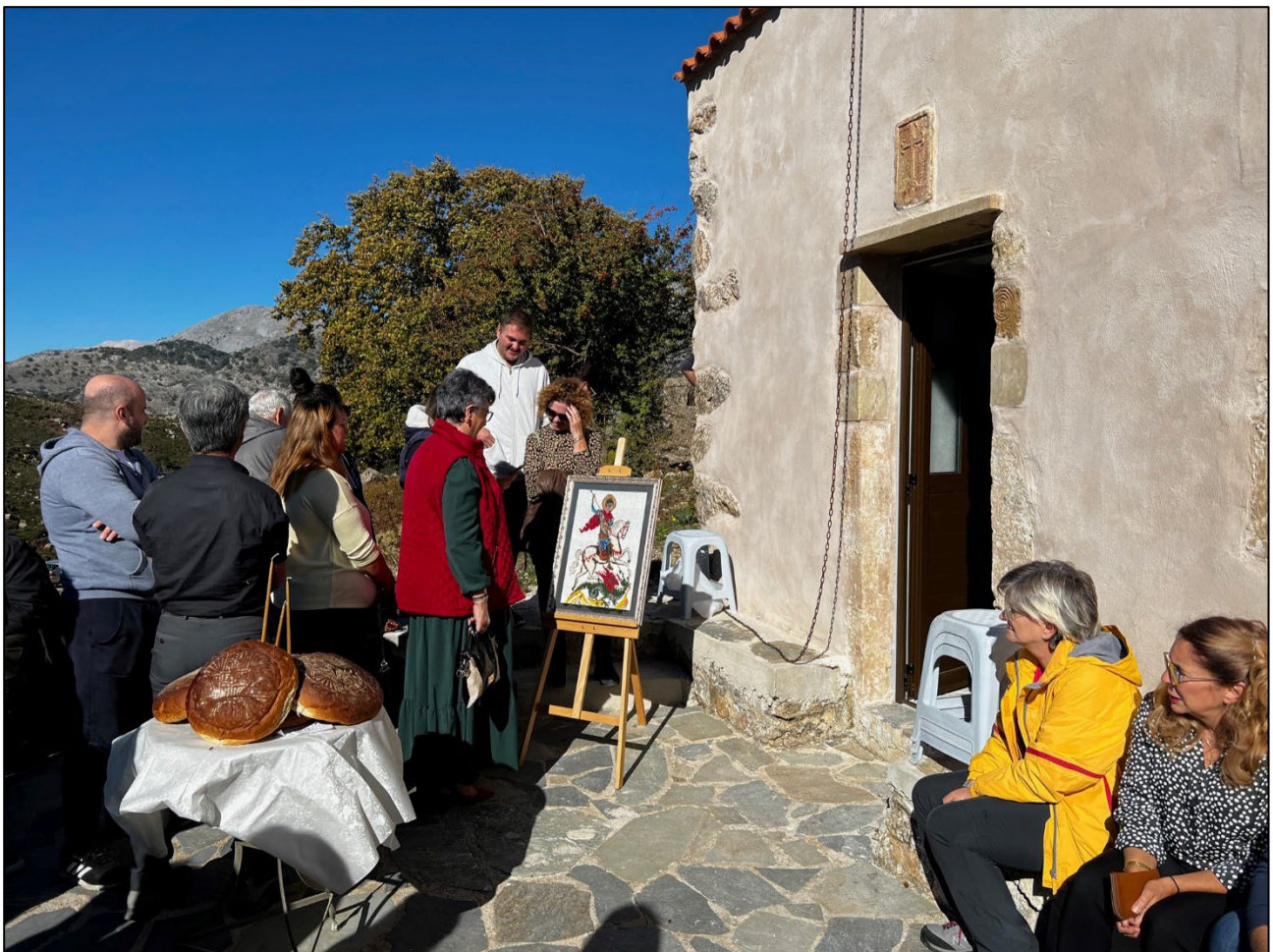
Abbildung 1: Besucher:innen der Messe anlässlich des Gedenktags des Heiligen Georgs, dessen Ikone vor dem Eingang der Kapelle in Kallikratis aufgestellt wurde

Zunächst einmal müssen wir aber verstehen, um was für eine Art von Fest es sich dabei überhaupt handelt, an welchem die deutsche Gruppe teilnimmt. Was hat es also mit diesem mysteriösen Heiligen auf sich?