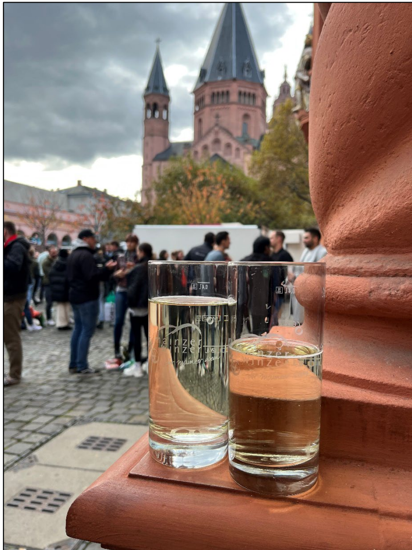
Abbildung 1: Auf dem Liebfrauenplatz, 05.11.2022

zehr vor Ort ausgeschenkt (s. Abbildung 1). Zeitgleich und in direkter räumlicher Nähe findet der Mainzer Wochenmarkt statt. Dort werden Backwaren, Antipasti, belegte Brötchen und weitere Speisen auch für den örtlichen Verzehr verkauft. Unter anderem gibt es dort die für Mainz typische Mahlzeit „Weck, Worscht und Woi“. 3 Besucher:innen des Marktfrühstücks nutzen dieses Angebot, um ein „Frühstück“ zusammenzustellen, das mit einem passenden Wein kombiniert werden kann.