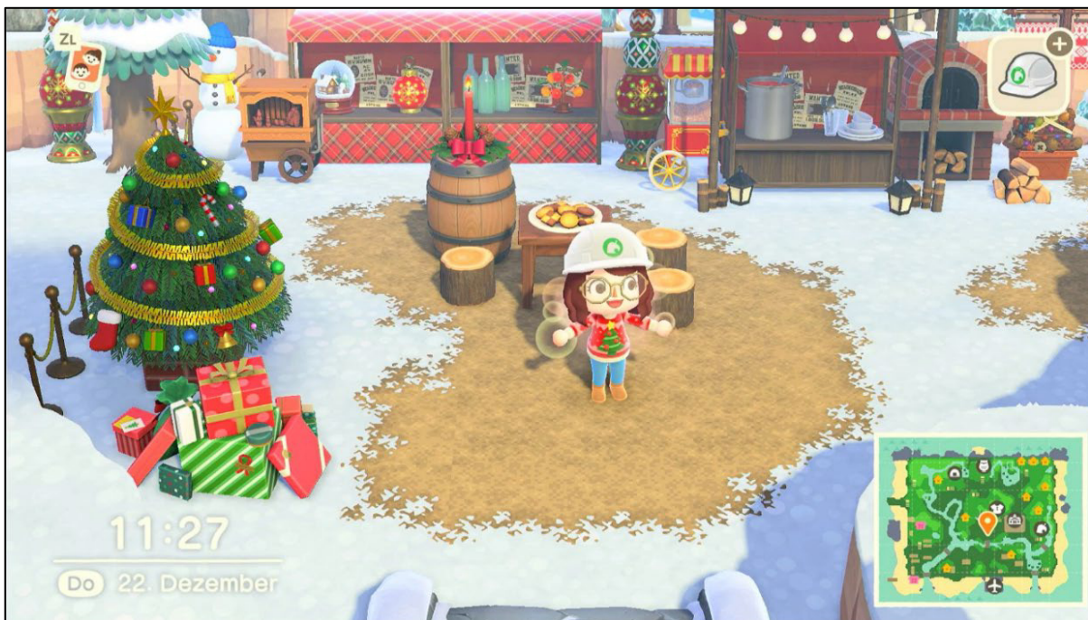
Abbildung 1: Weihnachtliche Dekoration in „Animal Crossing: New Horizons“ (Screenshot: Marie-Sophie Schäfer)

in tierischer Form einziehen können, die dann die Population der Insel bilden (vgl. Totten 2020, 89). Das Gameplay ist so aufgebaut, dass Spieler:innen größtmöglicher Freiraum bei der Gestaltung ihres Spielerlebnisses geboten wird. Sie können auf ihrer Insel mit den NSC interagieren und dadurch Gegenstände erhalten oder kaufen, die vor allem dekorativen Zwecken dienen. Ziel des Spieles ist es, die eigene Insel so auszubauen, dass sie die höchstmögliche Wertung erreicht. Aber weshalb könnte dieses Cozy Game 2 mit den niedlichen Charakteren relevant für ein Projekt sein, dass sich mit Bräuchen in der Gegenwart beschäftigt?