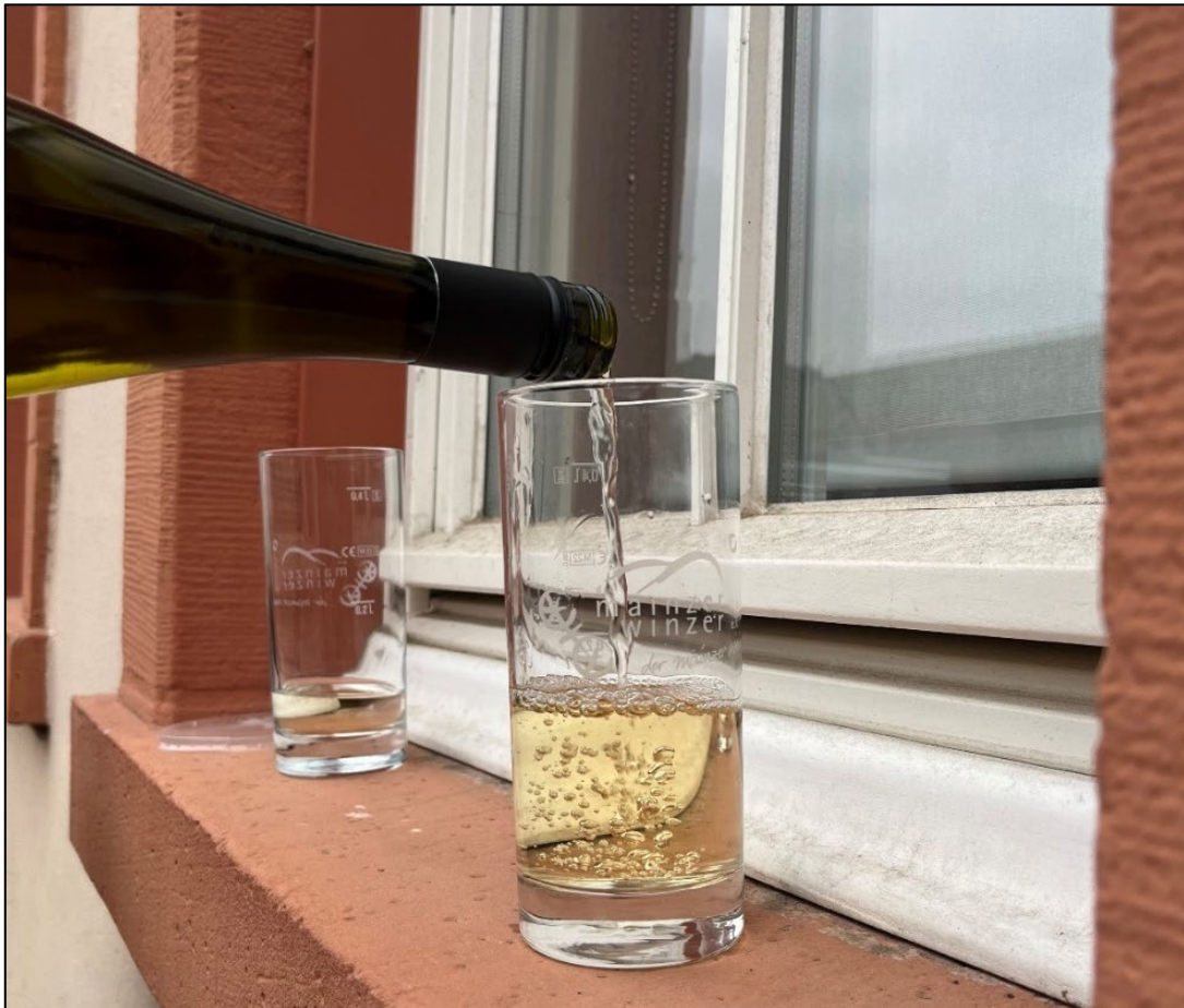
Abbildung 3: Eine Besucherin füllt ihr Glas auf, 12.11.2022

Mit Mineralwasser gemischt sind sie außerdem als Weinschorle im 0,4 l-Glas erhältlich. Zudem kann vor Ort Mineralwasser zum selbständigen Mischen einer Weinschorle gekauft werden. Neben den alkoholischen Getränken wird auch Traubensaft und -schorle angeboten. Die Pfandgläser tragen den Schriftzug „Der Mainzer Wein“ sowie das Logo des Mainzer Winzer e. V. und das Mainzer Rad aus dem Stadtwappen (s. Abbildung 2 u. 3).