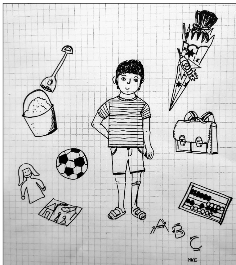
Abbildung 1: Vom Kindergarten in die erste Klasse (Illustration: Mariana Espinola)

In Mitteldeutschland pflücken angehende Schulkinder sie von einem Baum, wenn sie reif sind; in Süddeutschland wird sie von den Eltern an ihre ABC-Schützlinge übergeben: Es geht um die Schultüte oder Zuckertüte. Sie gehört seit über einem Jahrhundert zum Schulbeginn, so dass von einem fest institutionalisierten Brauchelement gesprochen werden kann. Was bedeutet sie heute? Hinweise und Antworten darauf habe ich während der Einschulungsveranstaltung der Rheinaugrundschule in Mannheim 2022 gesucht.