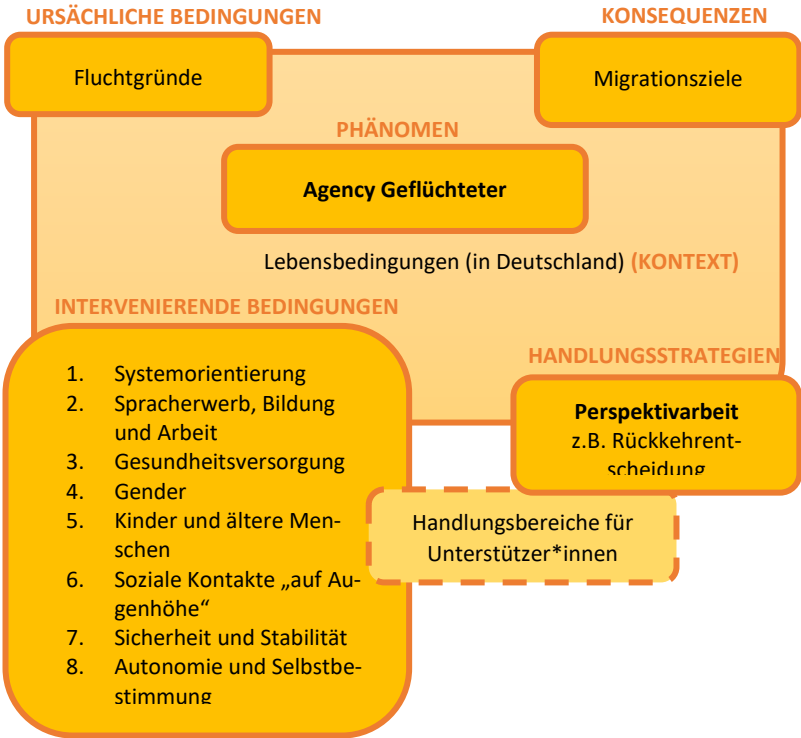
Abbildung 3: Kodierparadigma zur Agency Geflüchteter in der Perspektivarbeit

In der PRIM-Studie kamen leitfadengestützte Interviews zum Einsatz. Die Daten wurden mittels der Methode der Grounded Theory (Strauss/Corbin 1996) ausgewertet. Es erfolgte eine computergestützte Kodierung des Datenmaterials mithilfe des Programms MAXQDA. Die Ergebnisse der qualitativen Analyse lassen sich in drei identifizierte Felder unterteilen: Fluchtgründe und Migrationsziele (1), Rückkehr – (k)ein Thema (2) sowie Handlungsfelder für Bausteine guter Perspektivarbeit (3). Der Datenanalyse wird konzeptionell die Vorstellung zugrunde gelegt, dass sowohl die Personen der Zielgruppe als auch die der Mittlerzielgruppe jeweils „Perspektivarbeit“ leisten. Dies basiert auf dem Ansatz, dass die Personen der Zielgruppe bei ihrer Entwicklung von Zukunftsperspektiven und somit bei der Findung ihrer „Perspektive Heimat“ als gestaltende Akteur*innen anzuerkennen sind. Das im Forschungsprozess entwickelte Kodierparadigma zur „Agency Geflüchteter“ stellt die Kernthematiken der Analyse dar (siehe Abb. 3). Unter „Agency“ wird die Steigerung der Handlungsmächtigkeit der Akteur*innen verstanden, mit dem Ziel diese in ihrer sozialen und persönlichen Entwicklung zu unterstützen und ihre Ressourcen zu einer eigenständigen Lebensbewältigung zu mobilisieren.