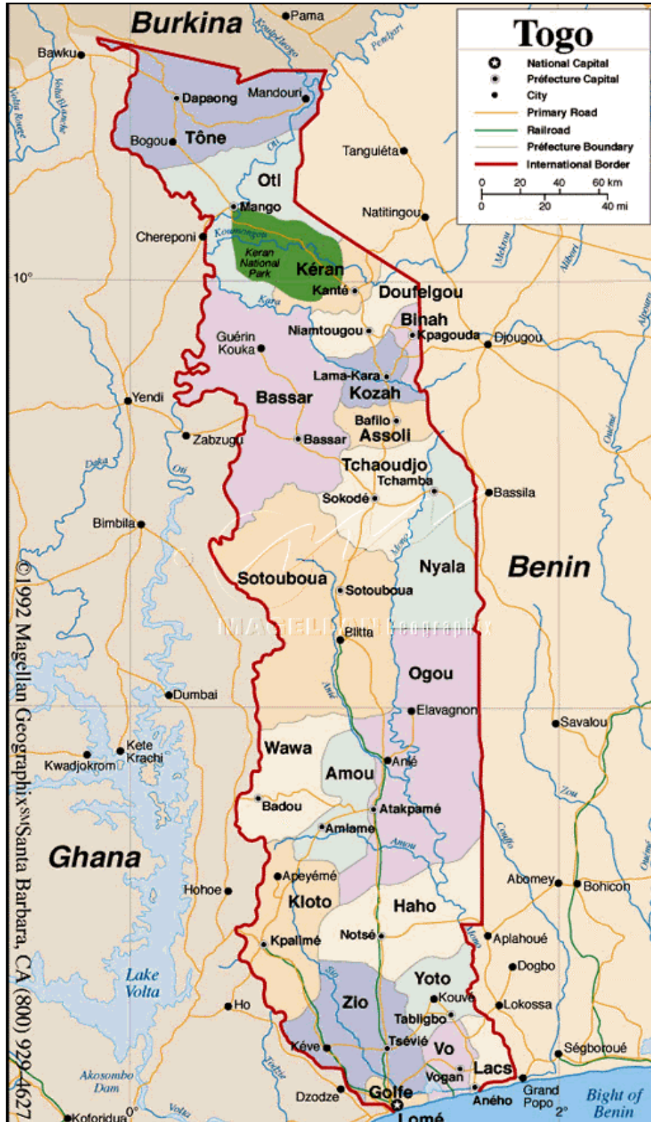
Karte 2: Togo