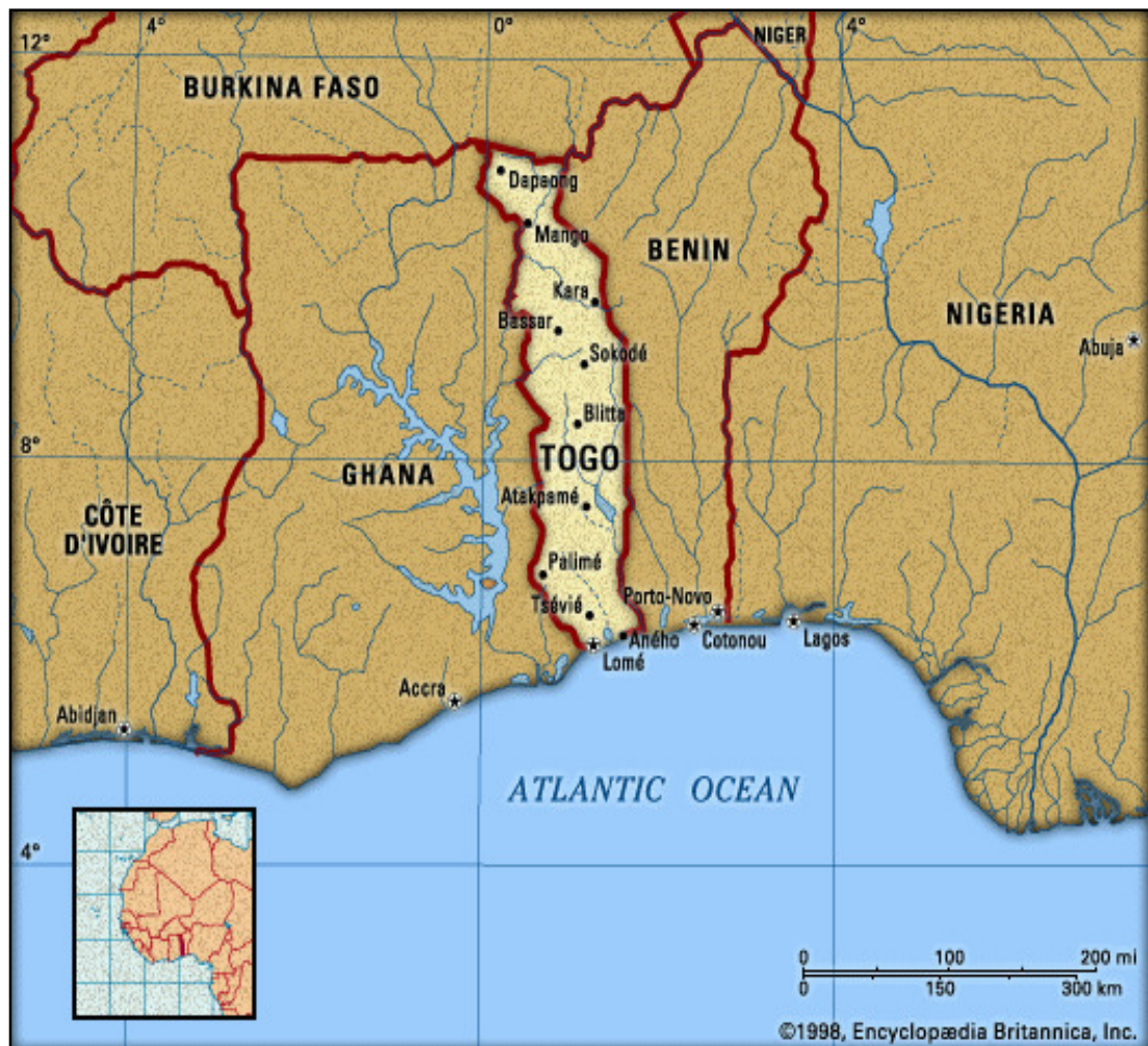
Karte 1: Westafrika

Quelle: Encyclopædia Britannica, Inc., 1998.