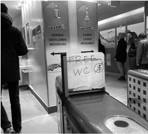
Abb. 6, Berliner Hbf, 30.03.2022

Schranke ein handschriftlicher, improvisierter Zettel: »FREE WC« (vgl. Abb. 6). 10