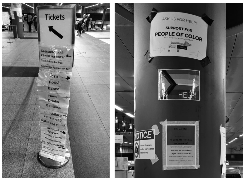
Abb. 2 und 3, Berliner Hbf, 31.03.2022

kommuniziert, sollten verdächtige Personen gesichtet werden. 7 Bis zum Frühsommer 2022 wurden diese informellen Warnhinweise dann nach und nach entfernt. An ihre Stelle traten großformatige Plakate des Freiwilligen-Kollektives Berlin Arrival Support (BAS), die in einheitlichem Layout (Farbe, Typografie, Piktogramme) und auf Ukrainisch bzw. Russisch, teilweise auch Englisch, Vermeidungsstrategien nannten und auf den allgemeinen Notruf sowie vier Berliner Hilfsorganisationen aufmerksam machten; die englischsprachige Version war dabei stark vereinfacht. Auch die Deutsche Bahn produzierte in Zusammenarbeit mit der Stadt Berlin vereinheitlichte Informationsplakate, die die Übersichtlichkeit im Bahnhofsraum erhöhen sollten. Im Unterschied zum wuchernenden ›Plakate-Wald‹ der akuten Krisensituation im März 2022 fanden sich im September, als die Ankunftsahlen abnahmen, insgesamt weniger, dafür aber stärker standardisierte und präziser platzierte Plakate