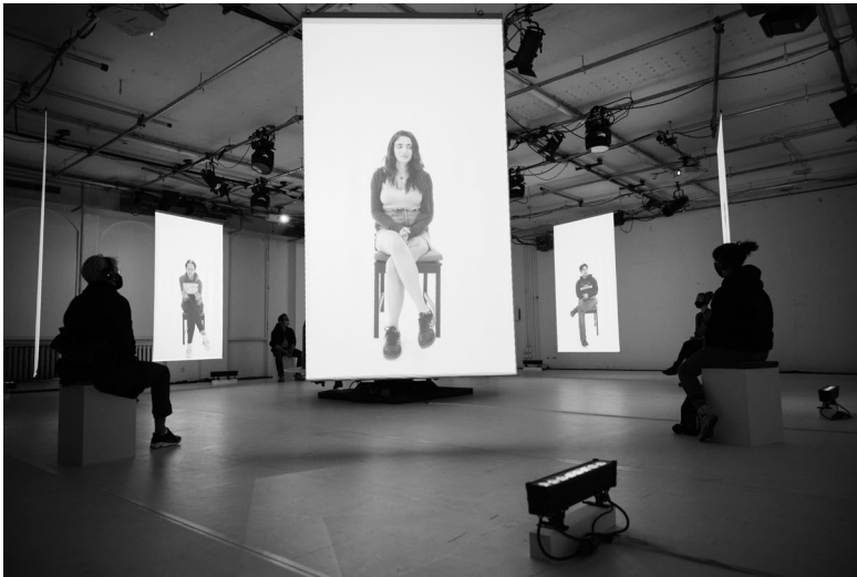
Abb. 1: Blick in den Raum von Ayivis The Kids Are Alright mit Zuschauer*innen (Sophiensaele, Berlin, 2020); © Mayra Wallraff, www.mayrawallraff.de .

eines buchstäblich rezipierbaren Lebens-Laufs eng mit den akustisch vermittelten ›Schlaglichtern‹ identitätsstiftender Selbst-Erzählungen. Die theaterkünstlerische Installation eines solchen Auseinandertretens von Seh- und Hör-Raum sowie Körperlichkeit und Stimmlichkeit seiner Akteur*innen lässt sich als eine Art fluider Erinnerungsraum aus Bild- und Klangwerten interpretieren.