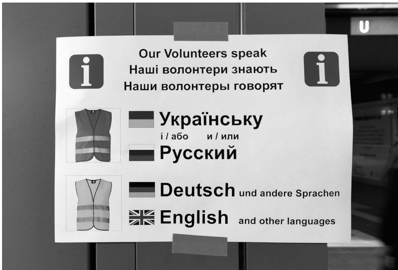
Abb. 5, Berliner Hbf, 30.03.2022

Russisch, Gelb für Deutsch und/oder Englisch (sowie alle anderen Sprachen). 8 Einem internen Koordinationsdokument der Helfenden zufolge stehen die Farben Gelb und Orange außerdem für eine Rollen- und Aufgabendifferenzierung. Die Träger oranger Westen werden gesondert als »Translatoren« bezeichnet und von den Trägern gelber Westen unterschieden. Da Menschen, die für die orangen Westen in Frage kommen, knapper sind als die anderen, werden sie an strategischen Orten im Bahnhof positioniert: am Bahnsteig, um ankommenden Geflüchteten direkt bei der Ankunft mit Informationen zu helfen, bzw. im und vor dem Reisezentrum der Deutschen Bahn, um dort Kommunikationsprobleme zu lösen und anderweitig zu helfen. Entsprechend wird innerhalb der Kategorie der Trägerinnen oranger Westen noch einmal zwischen Translatoren für »Inside« ( im Reisezentrum) und »Outside« ( vor dem Reisezentrum) differenziert. Diejenigen für drinnen sollen Ukrainisch oder Russisch und Deutsch sowie Englisch beherrschen, diejenigen für draußen Ukrainisch oder Russisch und Englisch.