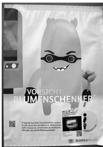
Abb. 1, Berliner Hbf, 14.09.2022

Informelle Papierausdrucke. Zunächst hängten freiwillige Helfende zahlreiche PC-Ausdrucke sowie handschriftliche Zettel mit Informationen für die ankommenden Geflüchteten aus. Sie nutzten dafür reguläre Orte der Wegeleitung, Wände und mobile Aufsteller, was zeigte, dass die