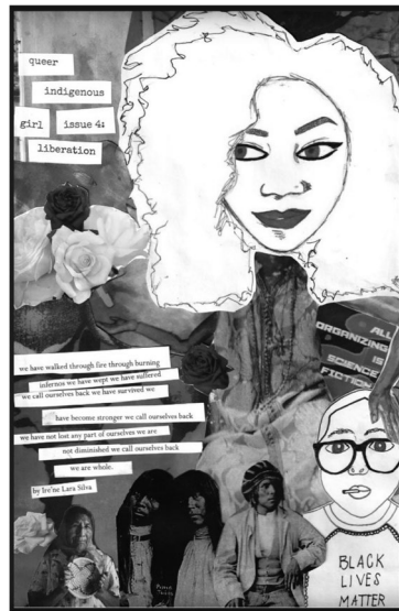
Abb. 2: Cover von Queer Indigenous Girl, Issue 4