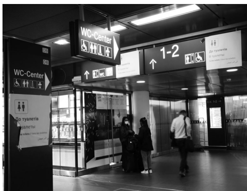
Abb. 4, Berliner Hbf, 15.09.2022

allgemeineren Hilfsbereitschaft zu werten. Durch den Einsatz dieser Farben und Sprachen soll eine gezielte Adressierung von Geflüchteten erreicht werden. Die Farben übernehmen hier also eine regulierende Funktion bezogen auf die räumlich-lokalen Verhältnisse des Bahnhofs. Neben dieser Steuerungsfunktion partizipiert die Farbcodierung aber auch am bedeutungsgenerierenden layering der neuen Beschilderung. Das tut sie im Verbund mit dem Schriftbild des Ukrainischen und Russischen (kyrillisches Alphabet) sowie dem Material und der Art der Anbringung der Beschilderung. Der Translationsraum des Bahnhofs (sowie pars pro toto der Bundesrepublik) evoziert hier mit den Nationalfarben (Flagge) sowie bestimmten Graphemen (Kyrillisch) für die Ukrainerinnen einen Heimatraum und damit eine Art ›semiotische Diaspora‹, die affektiv als Willkommenskultur gerahmt ist. Selbst als die temporären Schilder schrittweise durch professionell gestaltete Plakate der Deutschen Bahn ersetzt werden, wird die gelb-blaue Farbcodierung weitergeführt und an prominenten Plätzen in Szene gesetzt. Auf diese Weise generiert der Berliner Hauptbahnhof aus der für instrumentelle Zwecke der gesonderten Ansprache von Geflüchteten eingesetzten Farbcodierung einen symbolischen Überschuss, der politische Qualität annimmt und die Zugehörigkeit der Ukraine und der Ukrainerinnen zu Europa signalisiert.