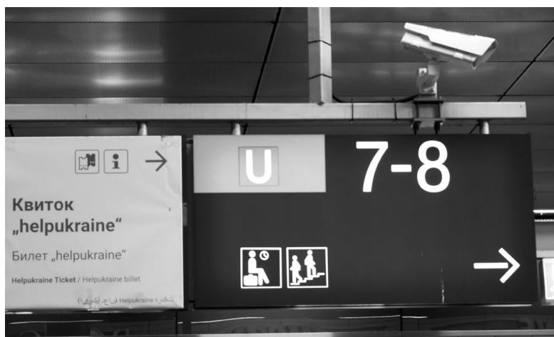
Abb. 7, Berliner Hbf, 15.09.2022